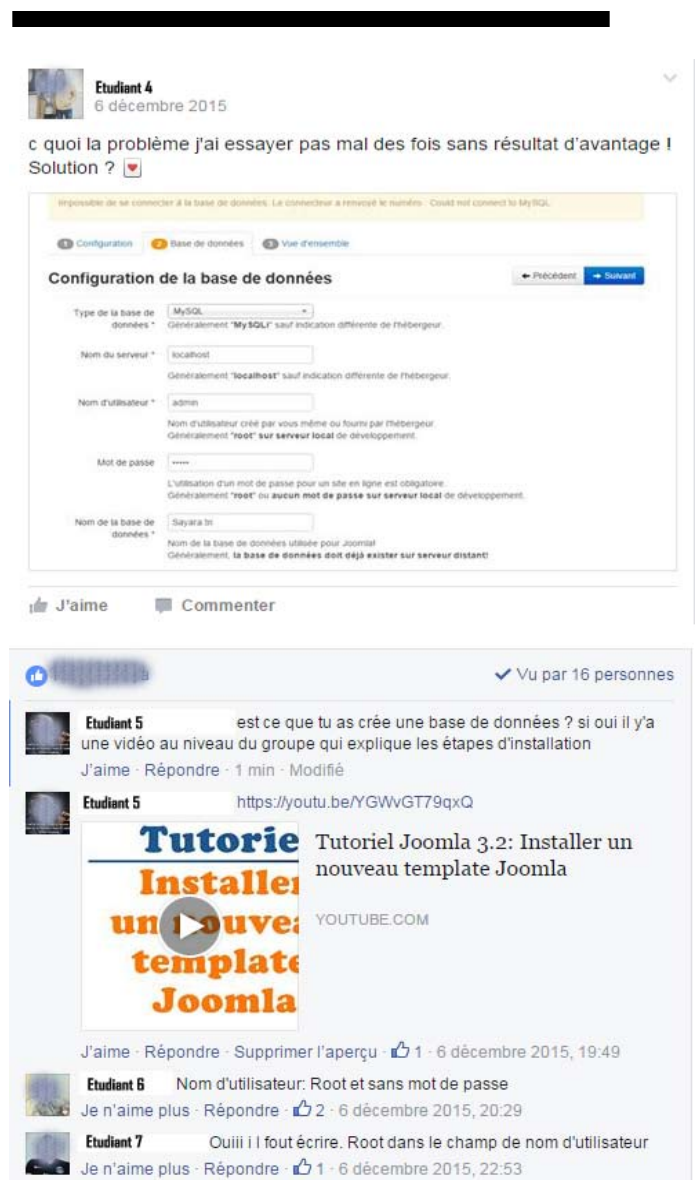
Figure 2 : Capture d'écran illustrant la résolution d'un problème rencontré par un étudiant à travers l'échange avec les membres du groupe Facebook

La capture d'écran ci-dessous illustre une discussion entre étudiants à propos d'une difficulté d'installation de Joomla! par l'un d'eux et comment quelques membres du groupe essaient de résoudre le problème.